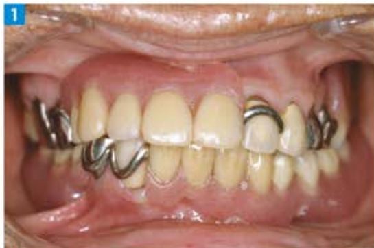
1 初診時、主訴となる義歯を装着した状態の正面観。