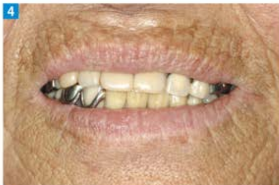
4 この義歯を装着すると長く噛んでいられず……。