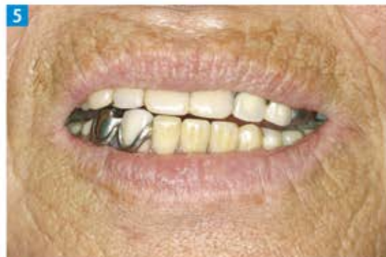
5 すぐに下顎をずらしたくなるという。