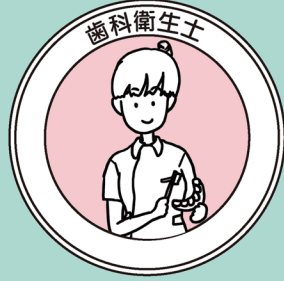
細菌のコントロール