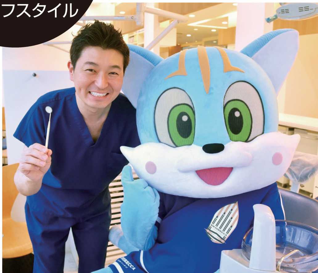
スポンサーを務めるサッカーチーム「プリオベッカ浦安」のマスコット・ベカ彦君が来院！