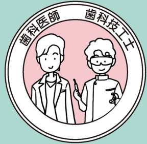
噛み合わせの管理