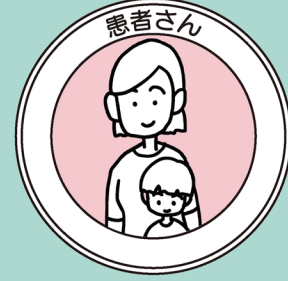
生涯にわたる 口腔の健康

私は歯科衛生士として30年以上勤める中で、患者さんから多くのことを学んできました。私が関わった長期症例を振り返りつつ、生涯にわたって患者さんの口腔の健康に寄り添う「かかりつけ歯科衛生士」の可能性を探ります。