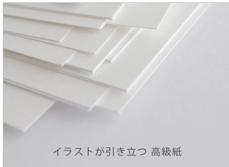
イラストが引き立つ 高級紙