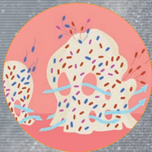
エビデンスに基づいた解説