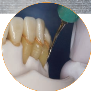
精度が高く効率のよい使い方