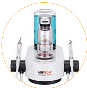
主要機種別 取り扱いの要点