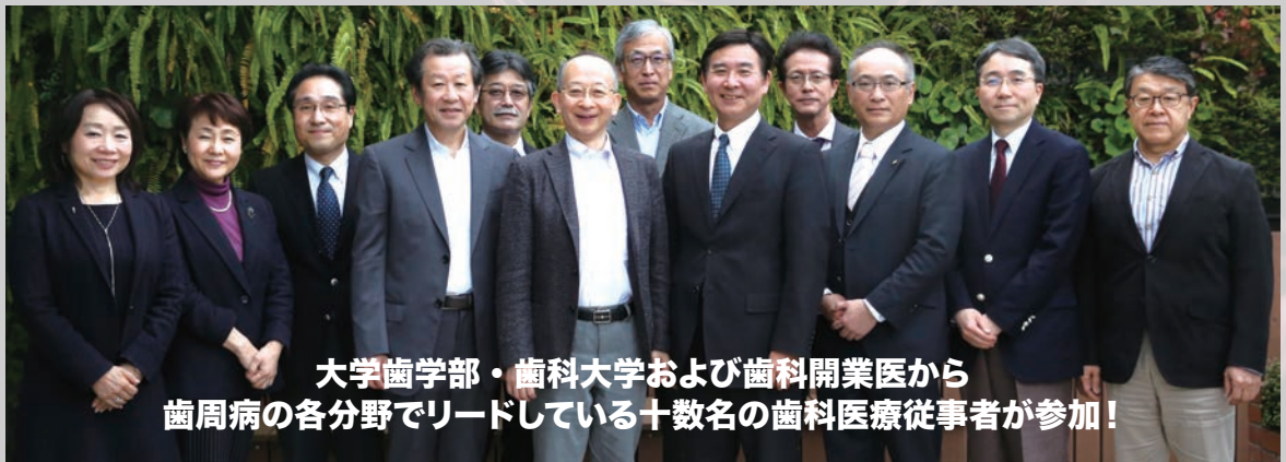
大学歯学部・歯科大学および歯科開業医から 歯周病の各分野でリードしている十数名の歯科医療従事者が参加!

Chapter 5 Er:YAG レーザーによる根面のデブライドメント (青木章)