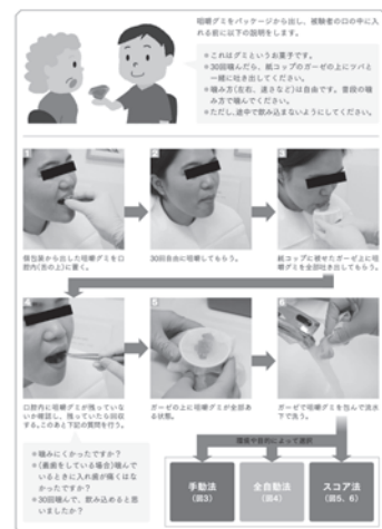
咀嚼機能測定の手順 咀嚼機能測定の手順は、咀嚼機能測定器を用いて咀嚼機能の測定を行います。測定は咀嚼機能測定器を用いて行われ、咀嚼機能測定器の測定結果に基づいて咀嚼機能の評価を行います。