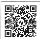
〈口腔ケアのマッサージ〉 QRコードでみる口腔ケア（見本）

医療従事者には説明用として、また介護者には手引書として、口腔ケアを提供する方々にぜひご活用いただきたい一冊です。