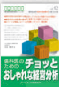
小山隆洋：著 定価本体 2,000 円（税別）