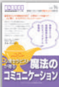
水木さとみ：著 定価本体 2,000 円（税別）