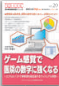
内田格誠：著 定価本体 2,000 円（税別）