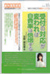
吉野真由美：著 定価本体 2,000 円（税別）