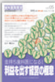
山下剛史：著 定価本体 2,000 円（税別）