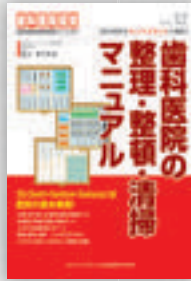
田上めぐみ：著 定価本体 2,000 円（税別）