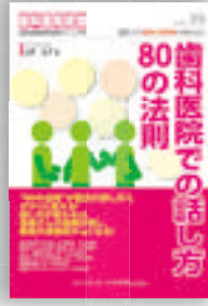
山岸弘子：著 定価本体 2,000 円（税別）