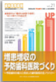
岩田健男／石川 明：著 定価本体 2,000 円（税別）