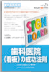
小山雅明ほか：著 定価本体 2,000 円（税別）