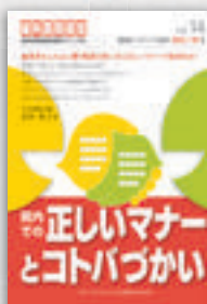
山岸弘子：著 定価本体 2,000 円（税別）