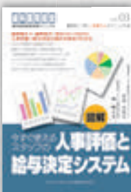
竹田元治／岡 輝之：著 定価本体 2,000 円（税別）