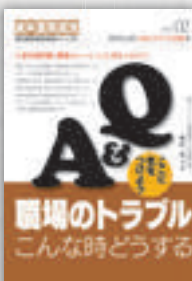
稲好智子：著 定価本体 2,000 円（税別）