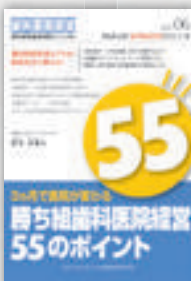
實谷光教：著 定価本体 2,000 円（税別）