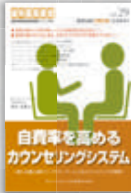
實谷光教：著 定価本体 2,000 円（税別）