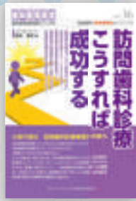
前田剛志：著 定価本体 2,000 円（税別）