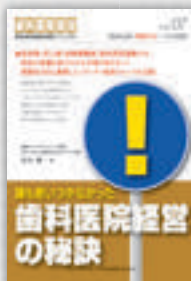
青山健一：著 定価本体 2,000 円（税別）