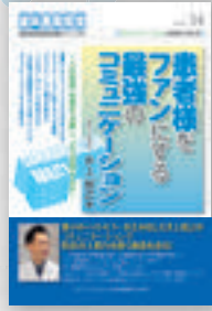
井上裕之：著 定価本体 2,500 円（税別）