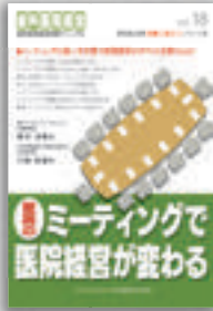
實谷光教・大崎政雄：著 定価本体 2,000 円（税別）