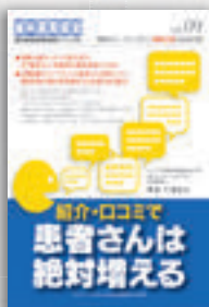
澤泉千加良：著 定価本体 2,000 円（税別）