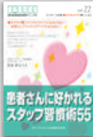
澤泉仲美子：著 定価本体 2,000 円（税別）