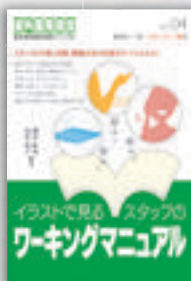
康本征史／山岸弘子：編著 定価本体 2,000 円（税別）