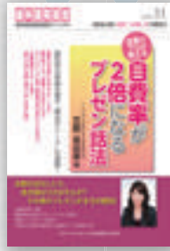
吉野真由美：著 定価本体 2,000 円（税別）