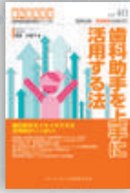
澤泉仲美子：著 定価本体 2,000 円（税別）