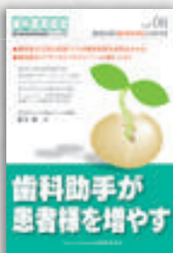
領木誠一：著 定価本体 2,000 円（税別）