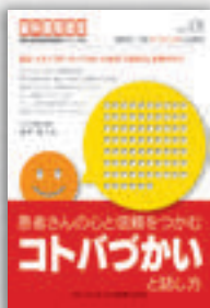
山岸弘子：著 定価本体 2,000 円（税別）