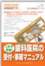
田上めぐみ：著 定価本体 2,000 円（税別）