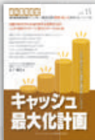
山下剛史：著 定価本体 2,000 円（税別）