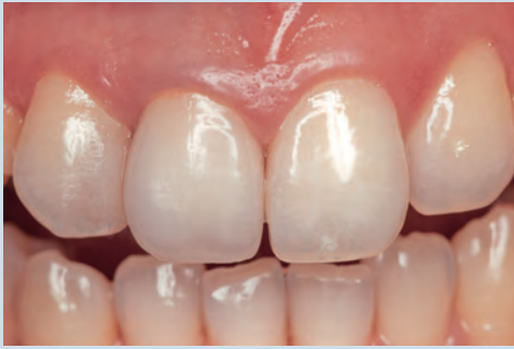
TYPE 1 より