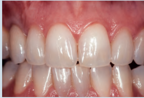
TYPE 6 より