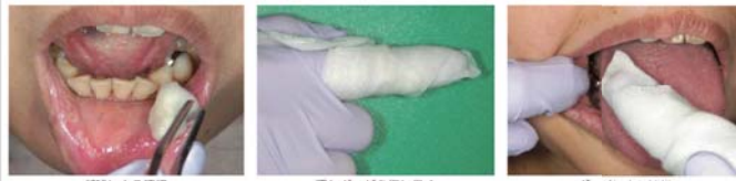
①18 口腔ケア 綿球による清掃 濡れガーゼを指に巻く ガーゼによる清掃