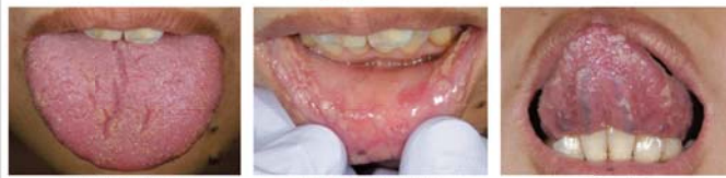
①17 初診から2週間目 舌背に黄色の小さな白苔 下唇にわずかな発赤と白苔 舌下に白苔