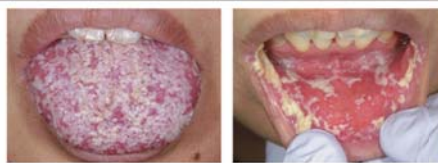
①16 初診時 舌、口腔粘膜全体に白苔出現 舌背にも多量の白苔

開始当初は、ブラッシング（軟毛ブラシ使 のアズノール®によるうがい（1日6〜7回） 固のスポンジブラシによる粘膜清拭、口腔乾 えて保湿の説明を行いました。粘膜炎が悪 は、次第に意欲が低下し、それに伴い嚥下機 低下し、唾液の垂れ流しもみられるようにな