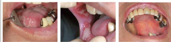
①20 嚥下造影検査 術後：皮弁を用いて再建 嚥下造影検査 明らかな訓練が確認されました。

そのため、訓練は一時中止し、口腔ケアも頻回のうが い（キシロカイン含有アズノール®使用）と粘膜炎への アズノール軟膏®の塗布のみとしました。