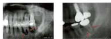
「6」の近心根は全周にわたって骨の破壊吸収像がみられます。しかし近心側歯槽骨は破壊されずに残っています。