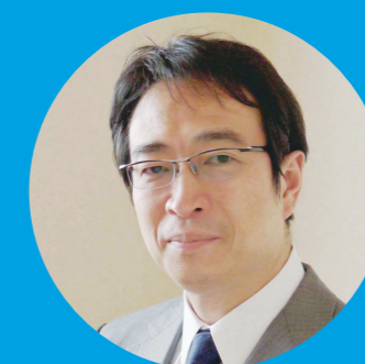
[原作者] 阿部 修