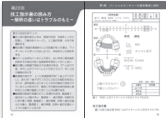
技工指示書の読み方