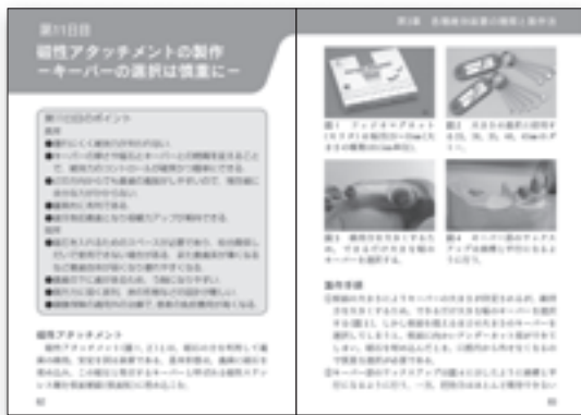
磁性アタッチメントの製作