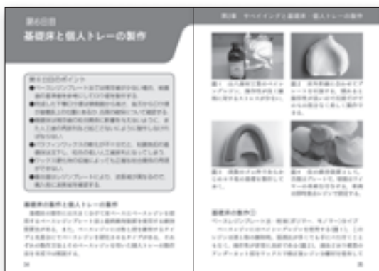
基礎床と個人トレーの製作