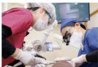
ドクターは5倍の拡大鏡にライトを付けることが多い。訪問診療に必須。