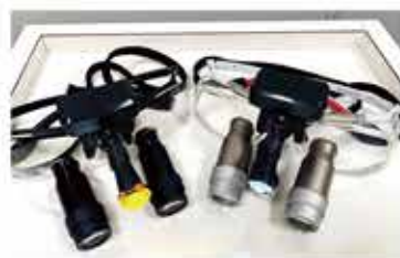
ルーペに簡単装着できるコードレスLEDライト(機松風「スパークSLT」)。

当院ではドクター、DHが全員使用しています。ユニットライトを使わなくなったため、アシストのライティング時に「見えない。ライト合わせて!」と注意する・されるストレスがなくなりました。