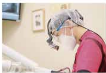
DHは『キムライト』がお薦め。1.5倍、4倍など。