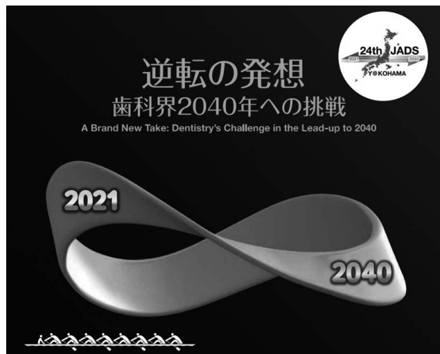
図1 シンボルデザイン—メビウスの輪はSDGs—後ろ向きで未来を予測して進む

ここでは、2019年から2040年を3つの期間に区切って、それぞれの期間で成し遂げる目標を掲げた。もちろん、これらの様々な目標は、時代の状況によって、見直しや中止を含む変更もあり得る。そこが「目標はフレキシブル」という所以である。2019年に目標を発信して、この学術大会で加速し、次の目標ポイントを2025年に置く。なぜ