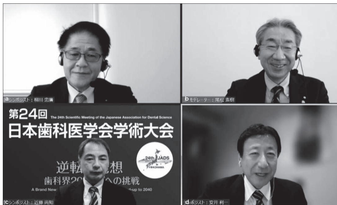
図1 シンポジウムのメンバー（敬称略）

学問としてスポーツ歯学がスタートしたのは1990年のスポーツ歯学研究会（現・日本スポーツ歯科医学会）で、その後、歯科医学教授要綱2007年改訂版から社会系歯科医学領域の一専門分野として記載され、2009年に日本歯科医学会認定分科会として認可されている 3) 。そこで、こ