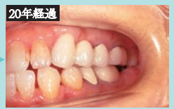
部分矯正アップライト症例