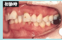
歯周矯正非抜歯症例

全顎矯正では Angle I・II・III級や外科的矯正、開咬、歯周矯正、顎関節症などに関して非抜歯・抜歯ケースをとりあげ、どのような理由でその治療方針に至ったかをていねいに解説。また、部分矯正ではアップライトや挺出、圧下、TAD、アライナー治療による叢生などの症例をとりあげている。長年の経験則から導かれた矯正臨床における治療選択の引き出しの多さは初学者はもちろんベテランの矯正家にとっても参考になる1冊。