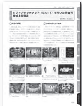
8章 インプラントメンテナンス