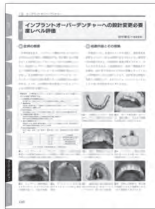
7章 インプラントオーバーデンチャー