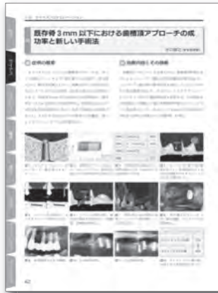
2章 サイナスフロアエレベーション