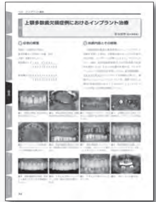
4章 インプラント審美