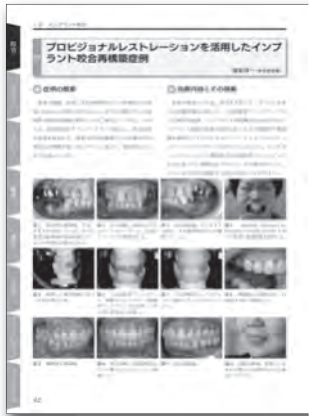
1章 インプラント咬合