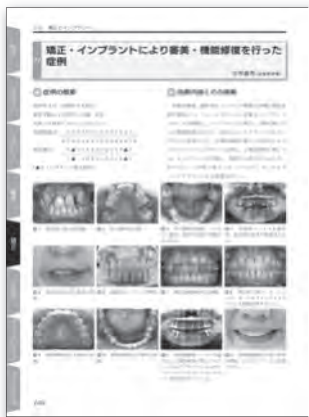
5章 矯正とインプラント