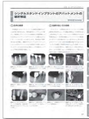
3章 インプラントリカバリー