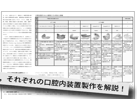
口腔内装置(OA)の種類 (第8章より)