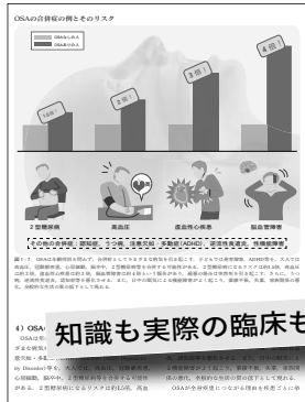
OSAの合併症の例とそのリスク (第1章より)