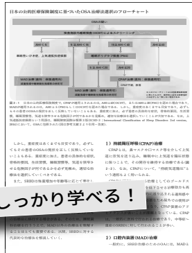
OSA 治療法選択のフローチャート (第2章より)