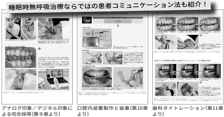
アナログ印象/デジタル印象による咬合採得 (第9章より) 口腔内装置製作と装着 (第10章より) 歯科タイトレーション (第11章より)