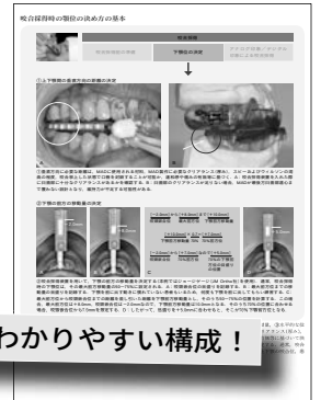
咬合採得時の顎位の決め方 (第9章より)

知識も実際の臨床もしっかり学べる！ 徹底的な“絵解き”にこだわった、わかりやすい構成！