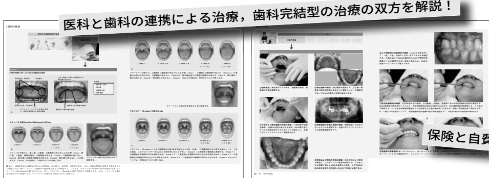
口腔内検査におけるスクリーニング事項 (第6章より) 口腔内検査の実際 (第7章より)

知識も実際の臨床もしっかり学べる！ 徹底的な“絵解き”にこだわった、わかりやすい構成！