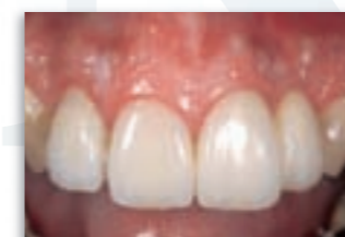
CROWN AND BRIDGE