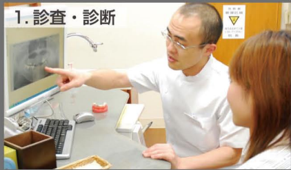
1. 診査・診断 診査・診断の後、治療する部位を入力します。

カウンセリングルームやユニットPCでスタッフが、患者さんと一緒にプロセシアを操作します。補足的な情報も交えて説明するので患者さんも理解しやすく、またスタッフがTCの役割を担うようになります。