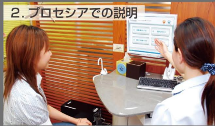
2. プロセシアでの説明 先生や衛生士さんが患者さんと一緒にプロセシアの画面を見ながら質問に答えています。