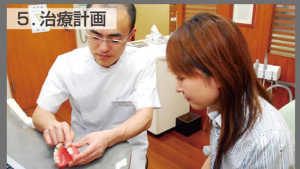
5. 治療計画 説明用模型などを使用して説明するとより効果的に説明が出来ます。