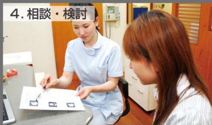
4. 相談・検討 選択した治療方法以外も印刷されるので患者さんは自宅で家族と相談できます。