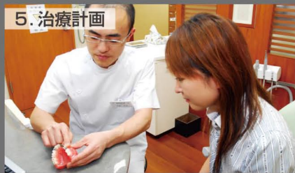
5. 治療計画 説明用模型などを使用して説明するとより効果的に説明が出来ます。