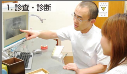
1. 診査・診断 診査・診断の後、治療する部位を患者さんにお知らせします。

診査・診断の後、患者さんにプロセシアをお渡します。患者さんが自分に合った補綴物を探す事ができ、また医院ではその回答や結果を知ることができるので次回来院時に的確なアプローチが可能です。