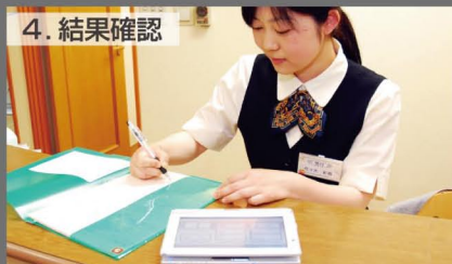
4. 結果確認 患者さんの選択した情報を管理画面で確認することができます。