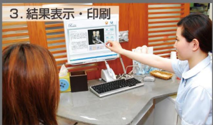
3. 結果表示・印刷 患者さんにより導き出された結果を簡単に説明してあげます。