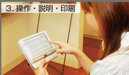
3. 操作・説明・印刷 質問にそって回答してもらいます。導きだされた結果の説明を確認し、必要であれば印刷を行います。