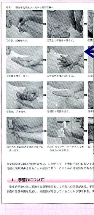
写真1 液体石鹸の手洗、「六つの基本手順」 1. 手洗いの目的、目的を説明する。 2. 石鹸を手に取り、泡立てる。 3. 手のひら、手背、指の間、爪の間、手首を洗う。 4. 水で洗い流す。 5. 手を乾かす。 6. 手洗いの重要性を説明する。 7. 手洗いの頻度を説明する。 8. 手洗いの場所を説明する。 9. 手洗いの時間について説明する。 10. 手洗いの効果について説明する。