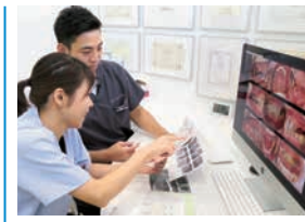
1部 こだわりペリオを成功に導くための医院マネジメント