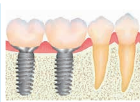
5部 こだわりペリオから学ぶインプラント治療