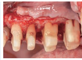
2部 明日から好きになる歯周外科