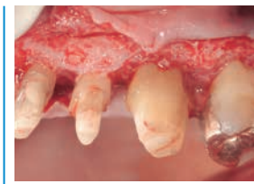
4部 絶対に裏切らない再生療法