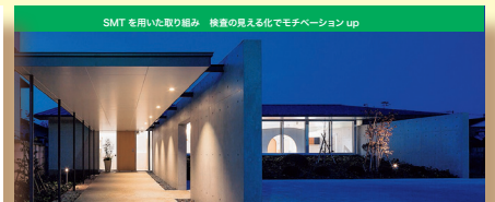
CASE 01 MAO デンタルクリニック 藤井 麻央