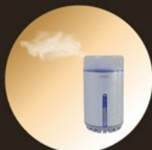
③ コントローラーのスイッチを入れ、ミストに乗せて香りが広がります。